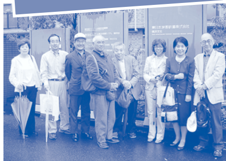
住民のみなさんと一緒にJR東日本と交渉（2008年）

JRからは津田山駅のエレベーター設置の施行時期が市内で唯一未定なので、橋上駅舎化の事業に合わせて早期にバリアフリー化を実現したいと伺っている」と答弁しました。